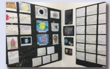
● 作文・絵の募集—わたしたちのみたか太陽系ウォーク