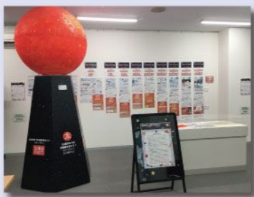
● 企画展示「太陽系ウォークはとまらない！」展（天文☆科学情報スペース）