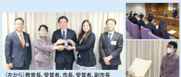
(左から)教育長、受賞者、市長、受賞者、副市長

※ 三鷹ネットワーク大学のWEBサイトでもお知らせしています。 下記のURLよりぜひご覧ください。 https://www.mitaka-univ.org/15th/#04