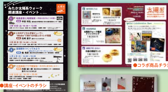
●講座・イベントのチラシ

みたか太陽系ウォークは、「三鷹の森 科学文化祭」(三鷹市及び国立天文台と実施に関する3者協定締結)の中心事業で、三鷹のまち全体を13億分の1の縮尺で太陽系に見立て、太陽系の大きさや距離を体感するスタンプラリーです。