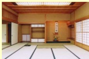
みたか井心亭 大広間