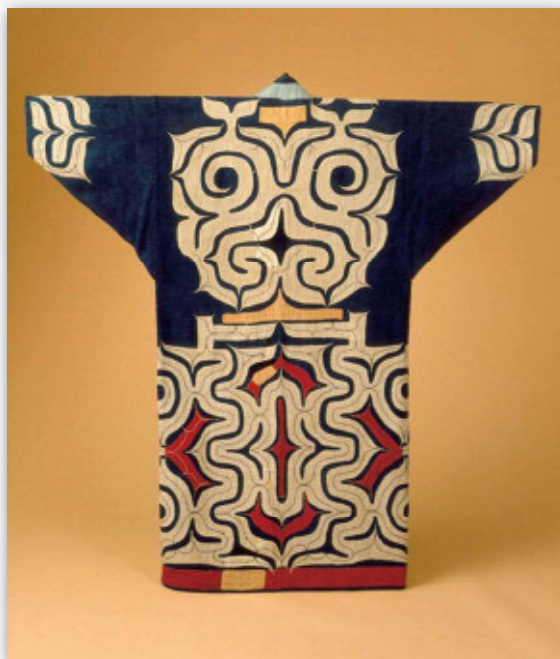
晴れ着「カバラミブ」

近代北海道では近代的土地所有を確立するために“地租創定”事業が行われましたが、アイヌ民族の多くはこのプロセスから“排除”されました。本講座では、1872年の北海道地所規則・北海道土地売賃規則に始まる一連の“地租創定”事業やアイヌ給与予定地問題に着目することで、近代日本とアイヌ民族との関係を考察します。