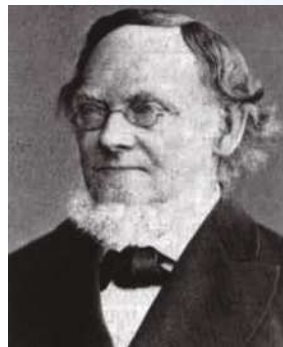
ヘルマン・グラスマン