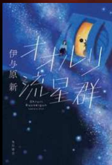
『オオルリ流星群』 表紙イメージ