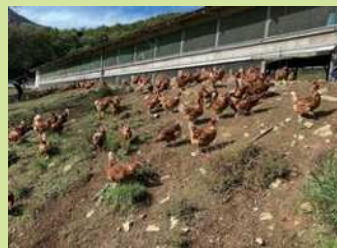
のびのびと過ごす採卵鶏（山梨県）

最近ではスーパーで平飼い卵をよく見かけるようになりました。とはいえ、日本では狭いケージ（バタリーケージ等）での飼育がまだまだ主流です。一方、欧州では2012年にバタリーケージを禁止しました。0有機、1放牧、2平飼い、3改良型（エンリッチ）ケージという4種の採卵鶏の飼育方法を示すために、卵の殻一つ一つに0から3まで数字が印字されています。家畜をのびのびと飼育することが、動物だけではなく人そして環境の健康にもつながる“ One Health ”や“ One Welfare ”の概念も生まれています。欧州の動向に注目しながら日本のこれからを考えましょう。