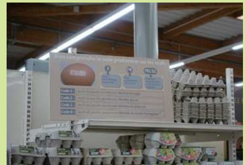
郊外型ハイパーマーケットの卵売り場（フランス）