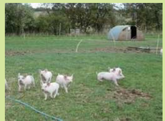
英国での放牧養豚