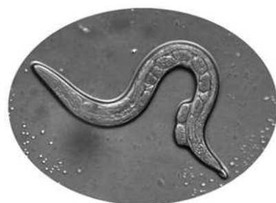
Cエレガンスの成虫

今回の講義では、周辺の温度変化が引き起こすCエレガンスの応答に着目します。遺伝子に異常があるCエレガンスや、神経の応答を観察できるCエレガンスを使って、生き物が環境の変化を受けてどのように行動するのかを調べた神経科学研究を紹介します。