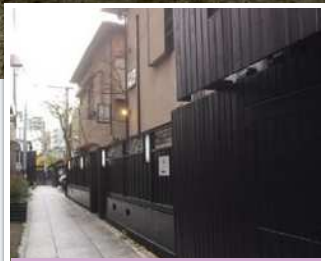
八王子花街(かがい)黒塀通り