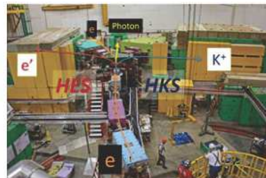
米国ジェファーソン研究所に設置した高分解能K中間子スペクトロメータ(HKS)と高分解能電子スペクトロメータ(HES)。