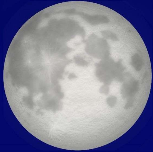
2026年 最も遠い満月 5月31日 17時45分 地心距離※ 約 40万 6,000 km