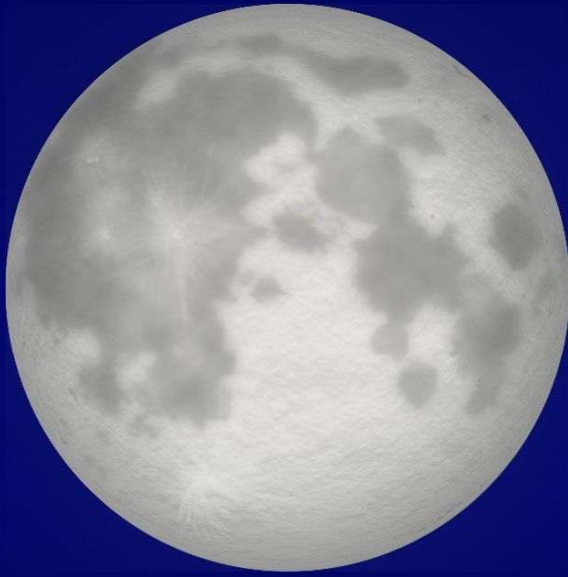
2026年 最も近い満月 12月24日 10時28分 地心距離※ 約 35万 7,000 km