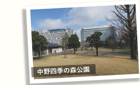
中野四季の森公園

三鷹をはじめとした JR 中央線沿線には、関東大震災や太平洋戦争での空襲さらに戦後の高度経済成長を契機に、多くの文学者が居住して珠玉の作品を発表し続け、現代文学に大きな影響を与えてきました。『中央線沿線の文学風景』シリーズは、著名な作家がどのように沿線地域を描いてきたのか、地域とどのように関わりを持ったのかなどを辿ることにより、文学作品を読む新たな楽しみを見つけるとともに、地域の魅力を再発見していく連続講座です。