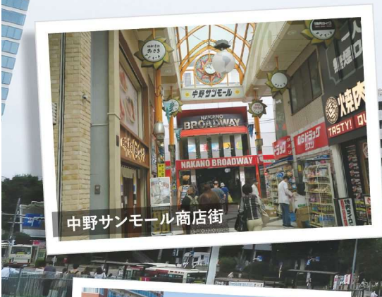
中野サンモール商店街