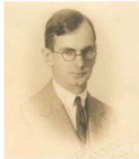
George de Rham

このコホモロジーを取りあげて、閉リーマン面や複素曲面の場合を例に挙げて観察する。